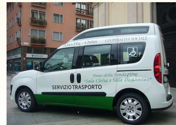
Automezzo Fiat Doblò donato alla Cooperativa A.la.t.Ha-Onlus di Milano per il trasporto di anziani e disabili